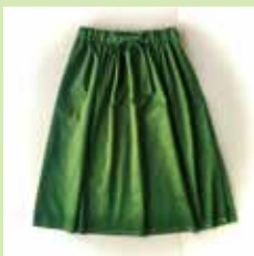
■ メルチデザイン 尾州デニムスカート等