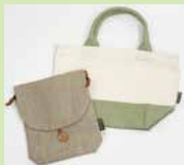
■ (株)艶金 「のこり染」 トートバッグ&ご朱印帳入れ等