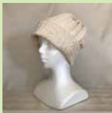
■ Team Apop 和綿のアポビキャップ等